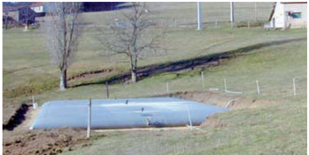
Almacenamiento de aguas blancas

Los datos, las fotografías y las ilustraciones no tienen valor contractual