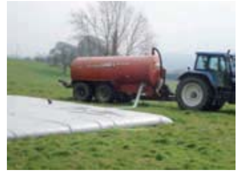
Almacenamiento de estiércol de bovino

Este almacenamiento permite eliminar los vertidos directos al medio natural y previene la contaminación de las aguas y filtrado al suelo. La cisterna está homologada por el ministerio francés de Agricultura (según el PMPOA) y por otros organismos europeos. Garantizamos una fabricación en conformidad con las especificaciones y reglamentaciones vigentes y contamos con referencias en el mundo entero.