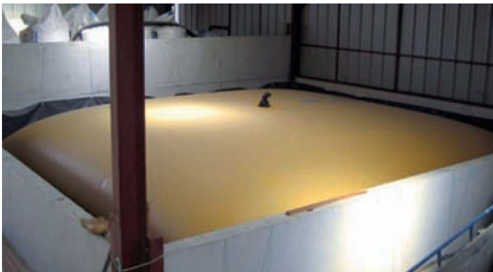
500 m 3 solución nitrogenada con retención por depósito y foso

Fotografías y textos © Labaronne-Citaf. Los datos, las fotografías y las ilustraciones no tienen valor contractual